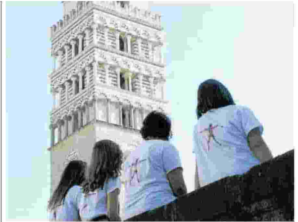
▲ I volontari Nei primi nove anni di vita del festival sono stati più di tremila i volontari. L'ultima edizione ha fatto registrare 30 mila presenze

Per poter mostrare ciò che non si può mostrare il fotografo romano è ricorso alla bellezza e all'arte. Si è fatto artista, là dove la fotografia ha preso storicamente a proprio carico la funzione di testimone